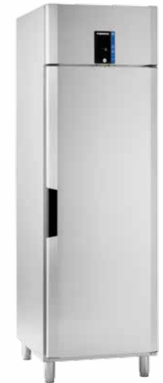
Porkka INVENTUS C6