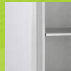
PU-isolering max 100 mm.