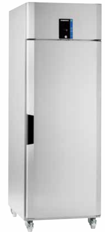
Porkka INVENTUS C7 med hjul (tillbehör)