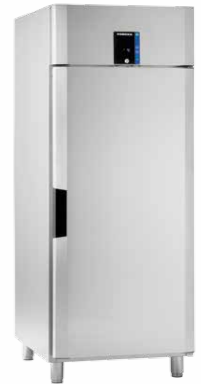
Porkka INVENTUS C8