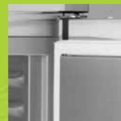
Enkelt utbytbar magnettätlist.