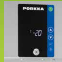
Digital temperaturdisplay med inbyggd mikroprocessor

Inre och yttre ytor är tillverkade av rostfritt stål AISI 304 med möjlighet till polyesterbelagd vit stålplåt på utsidan, om så önskas.