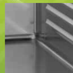
Botten i ett stycke med rundande hörn för enkel rengöring och hög hygien.